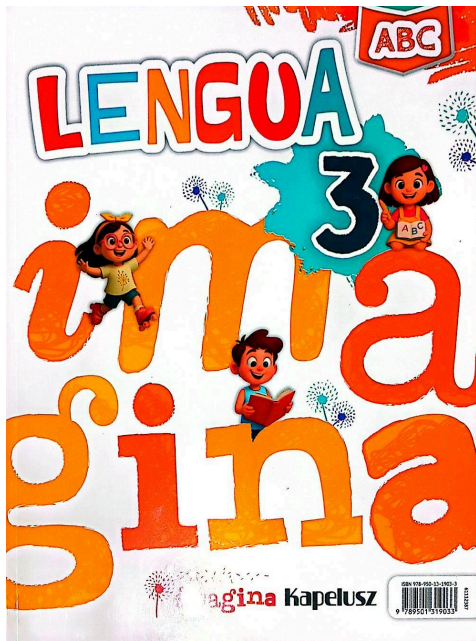
.Lengua 3 “Imagina ABC”, editorial KAPELUSZ.